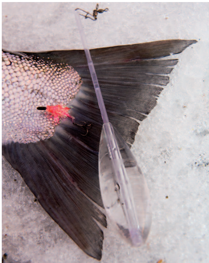
Lawsons topmonterede bombardarda kaster længere end Inno'en, men giver mere kludder.

REGISTRERING AF SMÅ HUG. Når man fisker med en fikseret bombardarda, skal fisken flytte bombardaden i vandet, før hugget registreres. Når man spinner jævnt hurtigt ind er dette ikke et problem, fordi man typisk har konstant god kontakt til fluen for enden af forfanget. Men når man fx under vinterfiskeri efter havørred fisker ekstremt langsomt med mange spinstop, kan der opstå problemer med, at registrere forsigtige hug. Denne problematik nedsættes måske marginalt ved, at bruge Law-